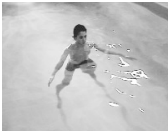
Cvičenie vo vodnom prostredí

sa využíva v hydrokinezioterapii (cvičenia vo vode).