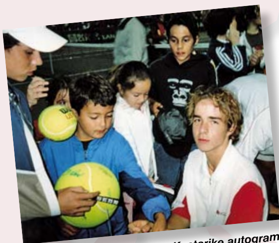
Andrej MARTIN rozdáva v Kostarike autogramy