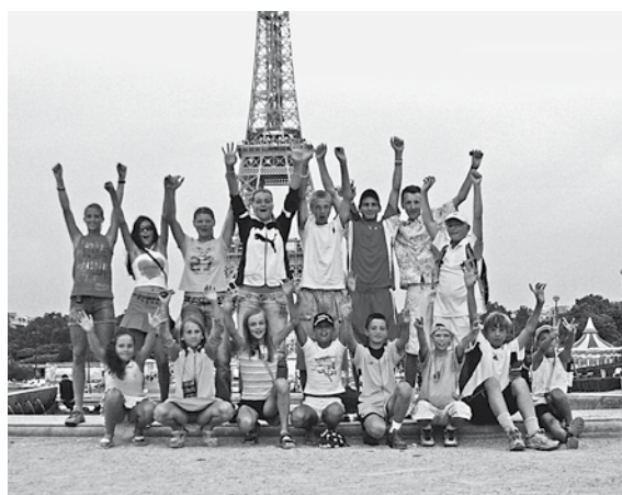
Naša kompletná výprava v Paríži

Zaujímavé je, že v tejto súťaži sú v každom roku dva celosvetové turnaje, v lete i zime a vždy na inom mieste. Aj pre našich hráčov by to mohla byť nová motivácia, hoci zatiaľ – na rozdiel od iných krajín – nezískavajú za dosiahnuté úspe-