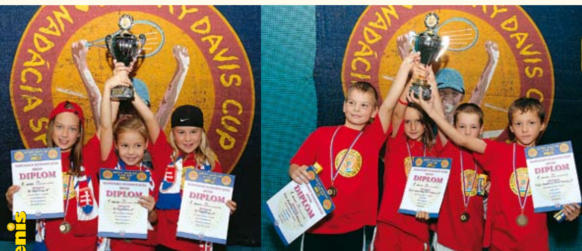
Víťazný tím dievčat z Topoľčian