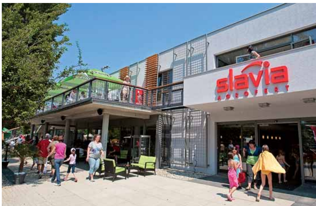
Pohľad na novostavbu klubových priestorov Slávie Agrofert Bratislava