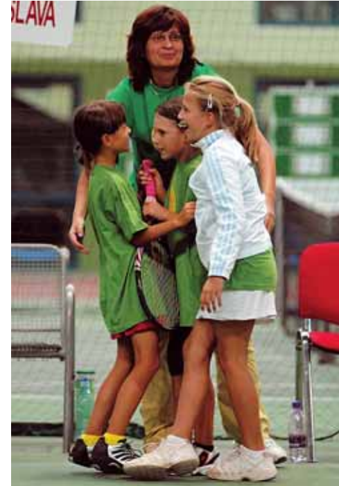
Slovanistky v objatí kapitánky