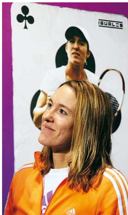
Justine HENINOVÁ pred svojou madridskou kartou, ktorá Belgičanke priniesla šťastie, lebo obhájila titul

Svoj rozprávkový tenisový rok zakončila Justine Heninová finálovým víťazstvom nad Mariou Šarapovovou po triapolhodinovom maratone 5:7, 7:5, 6:3. Za stavu 3:3 v treťom sete došli Ruske sily a Belgičanka