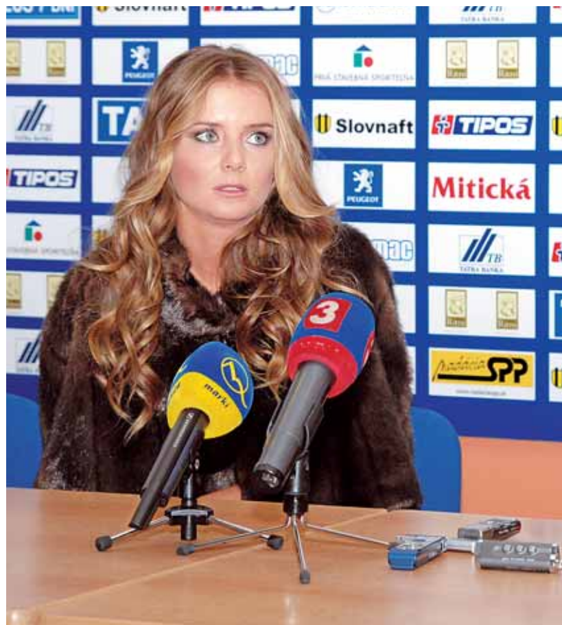
Stálice slovenského tenisu Daniela HANTUCHOVÁ a Dominik HRBATÝ bilancujú rok 2007