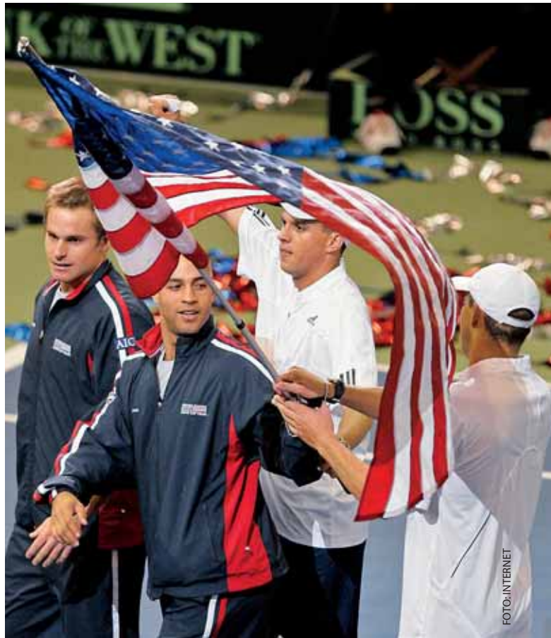
Andy RODDICK, James BLAKE a bratia Mike a Bob BRYANOVCI sa radujú z daviscupového víťazstva nad Ruskom

Mike Bryan: „Pred našou štvorhrou to boli nervy. Všetci od nás čakali rozhodujúci bod. Bol to enormný tlak.“