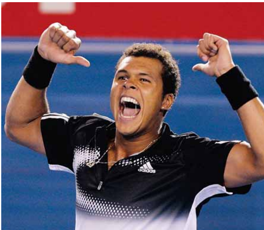
Nečakaný finalista: Francúz Jo-Wilfried TSONGA

Zrodilo sa aj množstvo nečakaných výsledkov. Sedemnásť nasadený, Chorvát Ljubičić, vypadol hneď v prvom kole, keď nestačil na kvalifikanta (!) Haaseho, ktorý mu dokonca dal v treťom sete kanára (!). Z nasadených sa vo dvojhre už v prvom kole lúčili aj Španiel Almagro, ktorý ostal na štíte Chorváta Čiliča (dotiahol to až medzi najlepších 16 hráčov) a Čech Štěpánek. Ten nestačil na Američana Spadeu, hoci v prvých dvoch setoch jasne dominoval (62, 62). Prvé kolo neprežil ani Argentínčan Chela, ktorého poslal predčasne pod sprchu Španiel Garcia-Lopez. Chelu nasledovali Brit Murray - tomu podložil nohu neskorší nečakaný finalista, Francúz Tsonga a Španiel Moya, ktorý po tuhom boji podľahol Rakúšanovi Koubekovi.