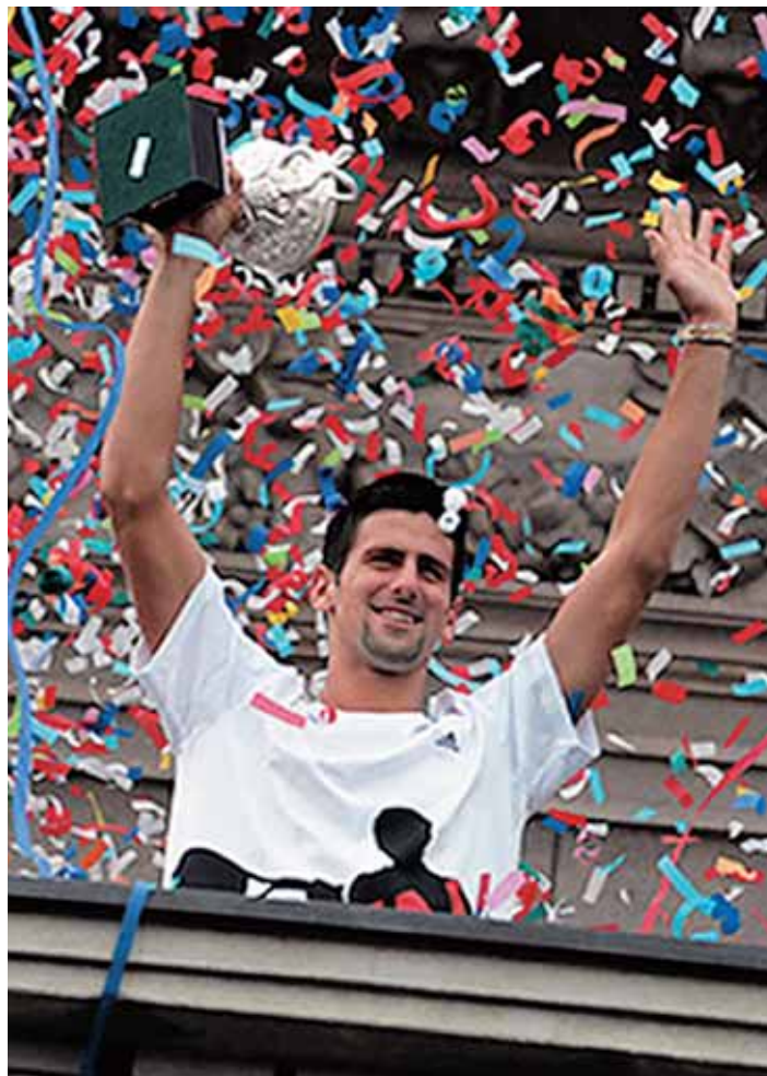
Novaka DJOKOVIČA po príchode do Belehradu vítali s veľkou slávnosťou