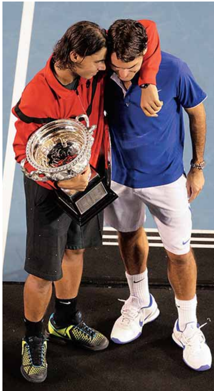
Šampión Australian Open Rafael NADAL a sklamaný finalista Roger FEDERER

Ďalšou morou boli pre mužov problémy s rozvrhom zápasov. Večerný program sa začínal o 19.30 hod. a neraz sa končil až v skorých ranných hodinách, čo mnohí – zdá sa, že oprávnene – kritizovali. Dal im v tomto smere za pravdu aj dvojnásobný víťaz Grand Slamu slávny Rod Laver, ktorý konštatoval: „Je hrozné, ak niekto skončí zápas o štvrté ráno a do postele sa dostane až o piatej.“ Preto skupina hráčov na čele s Federerom, Roddickom, Djokovićom a Baghdatisom usporiadateľom navrhla, aby sa vo večernom programe striedali zápasy mužov so zápasmi žien, čím by sa program mohol skončiť v „rozumnejšom“ čase, lebo stretnutia žien sú predsa len kratšie. Svojou troškou do mlyna prispel aj Španiel Fernando Verdasco. Po semifinálovom maratónskom dueli s Nadalom, ktorý sa stal najdlhším v histórii Australian Open (trval päť hodín a 14 minút, bol o 3 minúty dlhší ako zápas Becker - Camporese roku 1991) navrhol, aby sa oba semifinálové zápasy hrali v tom istom dni, čím by mali obaja finalisti rovnaký čas na regeneráciu síl. Za súčasného stavu mal Federer na oddych jeden deň k dobru.