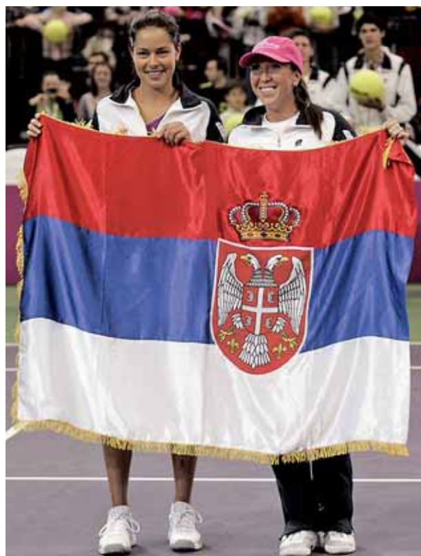
Srbsko vďaka Ane IVANOVIČOVEJ a Jelene JANKOVIČOVEJ postúpilo do baráže o I. svetovú skupinu

Americká zóna: Kanada – Paraguaj 3:0, ázijsko-océánska zóna: Austrália - Nový Zéland 3:0, euro-afriická zóna: Estónsko – Bielorusko 2:0, Poľsko – Veľká Británia 2:1.