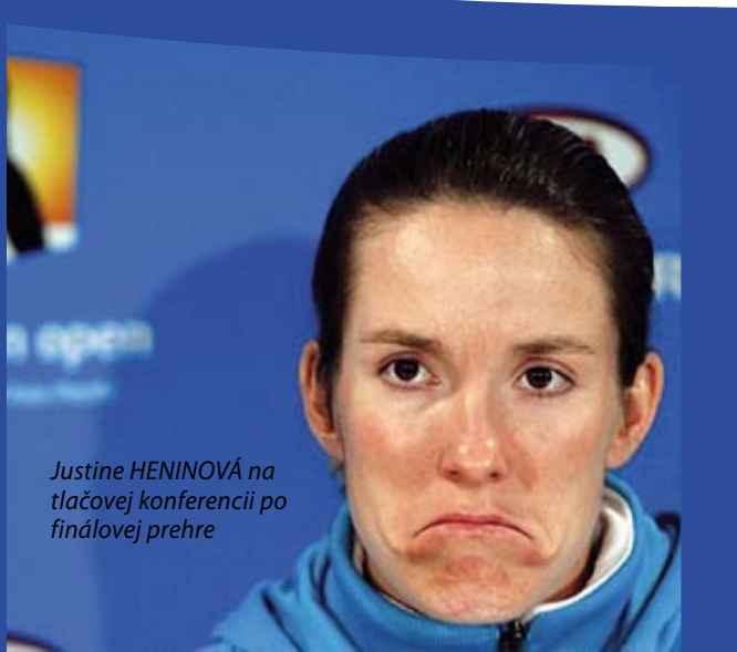
Justine HENINOVÁ na tlačovej konferencii po finálovej prehre