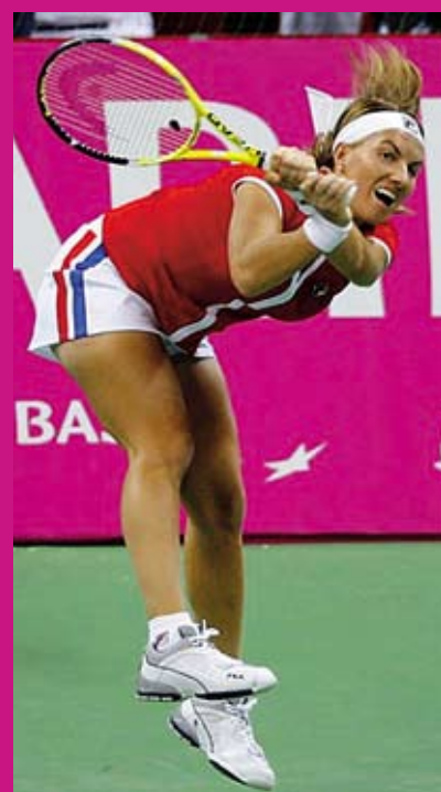
Tri hrdinky zo svetovej skupiny - Češka LUCIE HRADECKÁ, Američanka MELANIE OUDINOVÁ, Ruska SVETLANA KUZNETSOVÁ