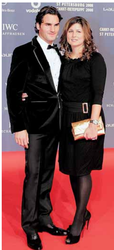
Roger FEDERER so svojou dlhoročnou priateľkou, bojníčkou rodáčkou Miroslavou VAVRINECOVOU

Federer (26) stihol ešte jednu prestížnu a už dlho avizovanú záležitosť: desiateho marca pred 19-tisíc divákmi v newyorskej Madison Square Garden odohral ďalšie exhibičné stretnutie s Petom Samprasom (36). Stručne: dvanásťnásobný