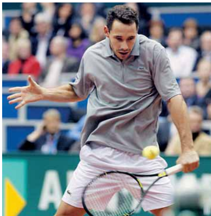
Francúz Michael LLODRA (27 r.) patrí medzi výborných deblistov, ale v tejto sezóne sa mu darí aj vo dvojhre – v Rotterdame vyhral svoj druhý tohtoročný turnaj