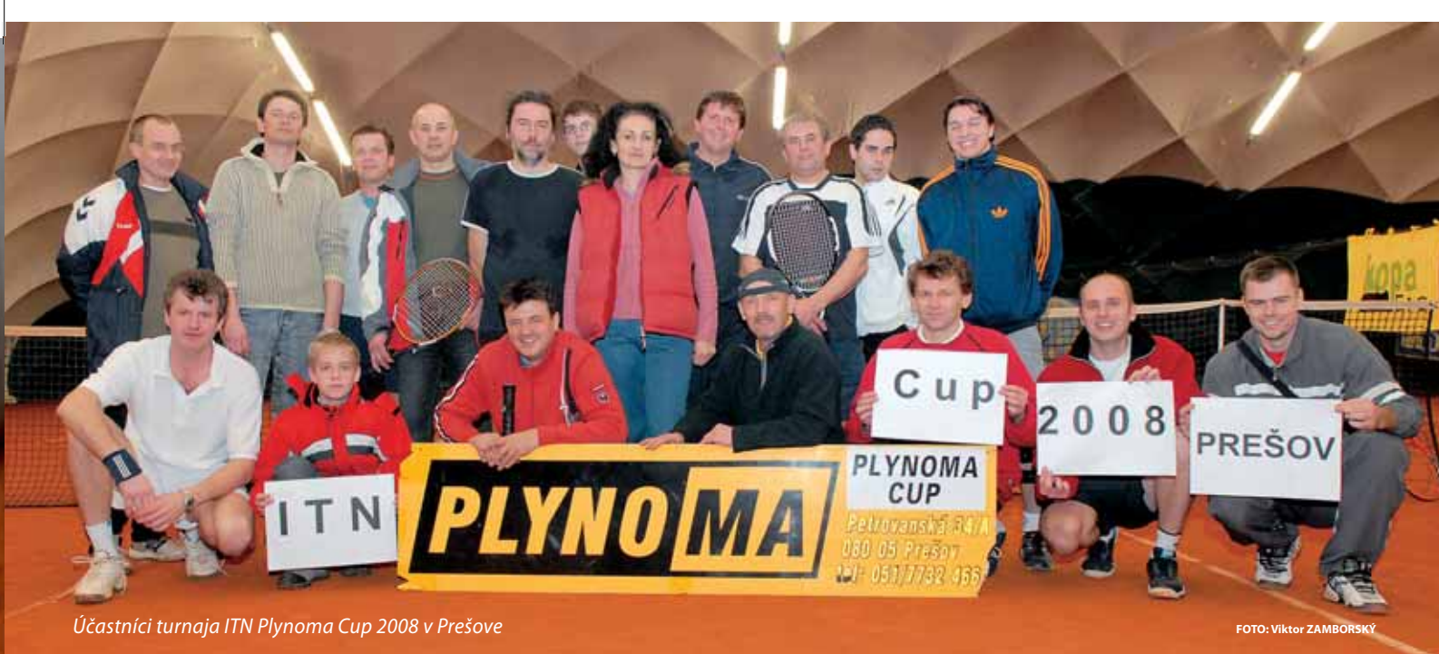
Účastníci turnaja ITN Plynoma Cup 2008 v Prešove