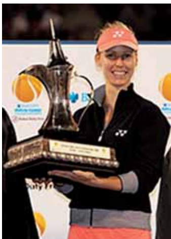
V arabskom svete sa darilo Ruskám: Maria ŠARAPOVOVÁ (vpravo), víťazka z Dohy a Jelena DEMENTIEVOVÁ s trofejou z Dubaja