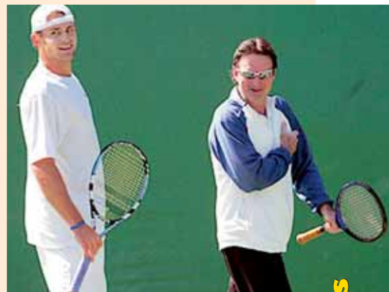
Andy RODDICK, keď ešte spolupracoval s CONNORSOM