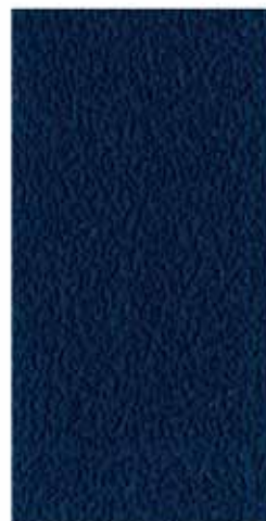
US OPEN BLUE™