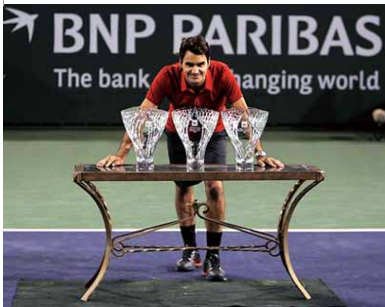
Roger FEDERER pózuje s trofejou pre Hráča roka 2009 série ATP World Tour, s Cenou Stefana Edberga za športový prístup a trofejou za víťazstvo v anketе športových fanúšikov ATPWorldTour.com