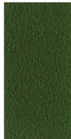
US OPEN GREEN™