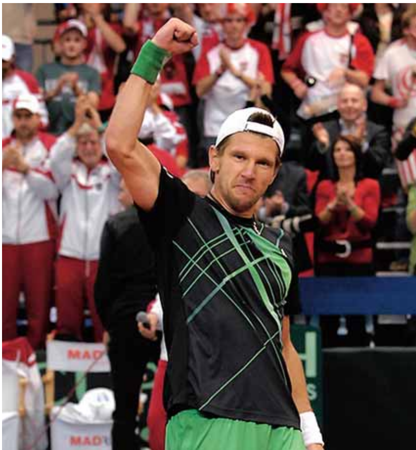
Jürgen MELZER sa právom tešil

Davisov pohár: Kľúčová bola štvorhra, Rakú