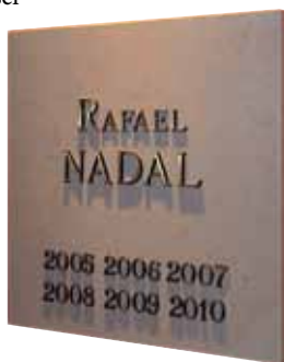
Na tabuľu Nadalových víťazstiev v Monte Carle po tohtoročnom turnaji pribudne rok 2011

Posledných sedem rokov sa však v Monte Carle skloňuje jediný meno: RAFAEL NADAL. Neohrozené a jednoznačne panuje monackej antuke. Do turnaja vstúpil v roku 2003 v šestnástich ako 109. hráč rebríčka ATP. Hneď v prvom kole mu skrížil cestu Karol Kučera. Vtedy 49. hráč