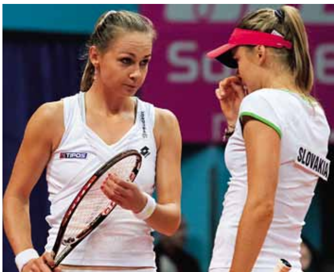
Magdaléna RYBÁRIKOVÁ a Daniela HANTUCHOVÁ vlani v Belehrade rozhodli o výhre Slovenska, tentoraz to do úspešného konca nedotiahli

A na záver: Všetky hráčky sa veľmi uznanlivo vyjadrovali o podpore obecenstva a zhodne konštatovali, že bolo úžasné. Hantuchová povedala, že takú podporu hľadiska ešte nezažila, Cibulková v zápase s Jovanovskou povzbudzovalo tak, že mala z toho až zimomriavky a Rybárikovú najviac mrzelo to, že sklamala skvelých divákov. Naozaj treba dať pred nimi klobúk dolu. Najmä za nedeľu. Ved' vydržať v hľadisku od obeda až do 21. hodiny a pritom neúnavne povzbudzovať, to je paráda, ktorá si zaslúži maximálny obdiv! (-rik)