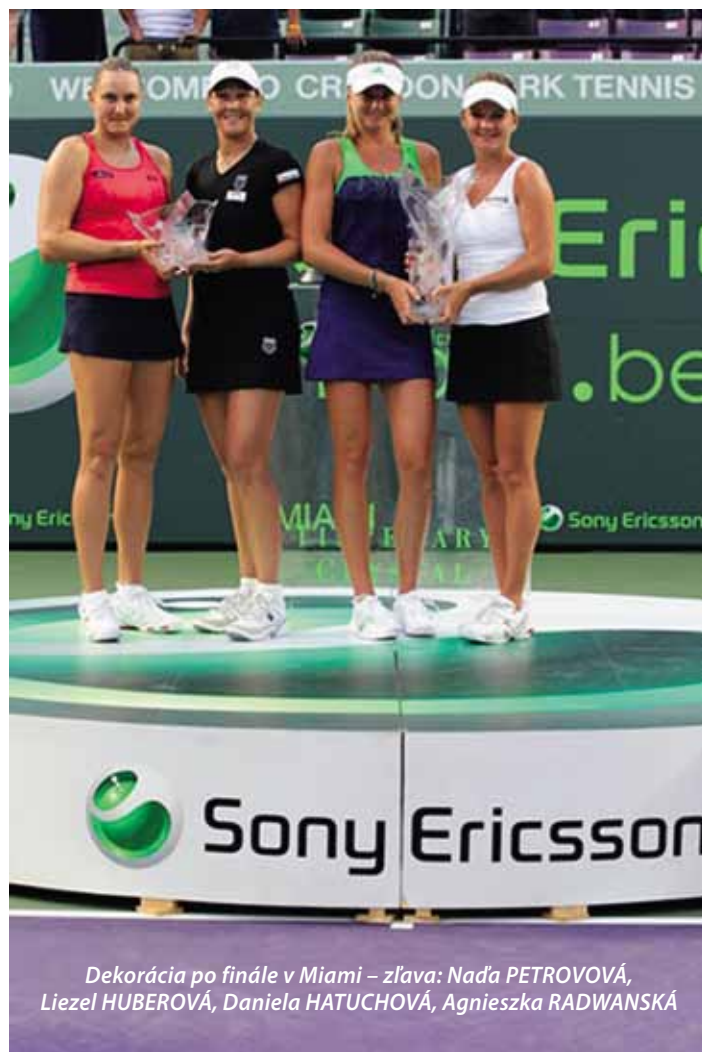
Dekorácia po finále v Miami – zľava: Naďa PETROVOVÁ, Liezel HUBEROVÁ, Daniela HATUCHOVÁ, Agnieszka RADWANSKÁ

Samozrejme, často si telefonujeme, teraz som s ňou po katastrofálnom zemetrasení hovorila častejšie, lebo som sa aj ja zapojila v Miami do tenisovej pomoci Japonku. Jej rodiny sa zemetrasenie bezprostredne nedotklo. Od Ai som sa naučila profesionálne. Bola schopná bojovať z plných síl aj keby sme prehrávali 0:6, 0:5. Na okruhu bola Sugijamová mojou najlepšou kamarátkou. Chodievala na turnaje ako komentátorka a vždy si sadneme – keď je to len