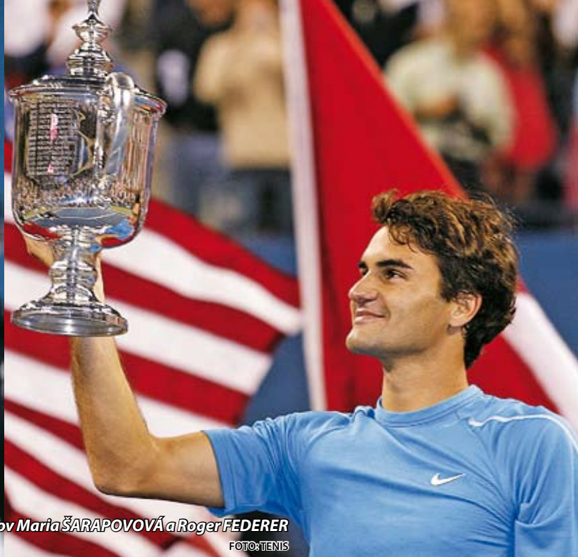
Obhajcovia titulov Maria ŠARAPOVOVÁ a Roger FEDERER