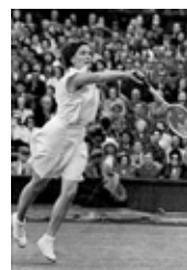
MARGARET OSBORNE duPONTOVA