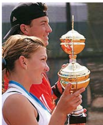
Majstri Európy do 16 rokov: Grigor DMITROV z Bulharska a Simona HALEPOVÁ z Rumunska