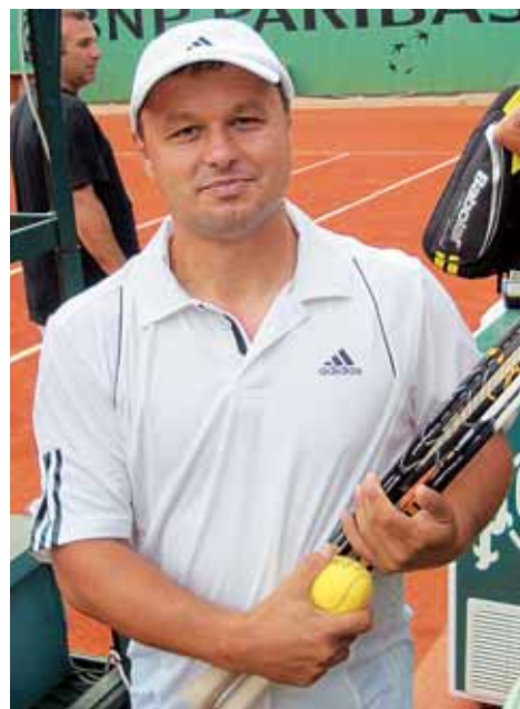
Marián VAJDA na Roland Garros, kde pod jeho vedením hral Hrbatý roku 1999 semifinále