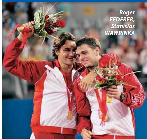
Roger FEDERER, Stanislas WAWRINKA